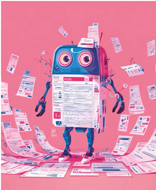
Midjourney AI prompt by GCO

Neben externen Quellen verfügen viele Unternehmen über umfangreiches, oft wenig genutztes internes Wissen: frühere Befragungsdaten – insbesondere offene, qualitative Antworten aus großen Umfragen oder Fokusgruppen –, Kundenstudien, Beratungsreports oder interne Wettbewerbsanalysen. GenAI kann helfen, Muster und Erkenntnisse aus dieser fragmentierten Informationsbasis herauszuarbeiten und ältere Insights wieder aktiv nutzbar zu machen. Bei der Arbeit mit internen Quellen hat Vertraulichkeit jedoch oberste Priorität. Das Hochladen proprietärer Daten in öffentliche Chat-Schnittstellen birgt das Risiko, sensible Unternehmensinformationen preiszugeben. Manager sollten stattdessen auf Enterprise-APIs oder lokal betriebene LLM-Deployments setzen, die Datensicherheit gewährleisten. Unter diesen Voraussetzungen wird GenAI zu einem leistungsfähigen Instrument, um jahrelang angesammeltes Wissen zu kombinieren – und isolierte Archive in handlungsrelevante Entscheidungsgrundlagen für aktuelle Fragestellungen zu verwandeln. ▶